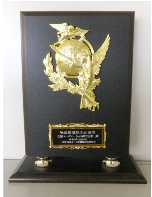
表彰楯「物流環境保全活動賞」 以上