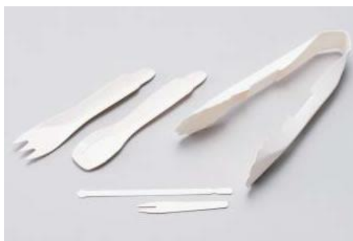
当社原紙を使用した紙カトラリー